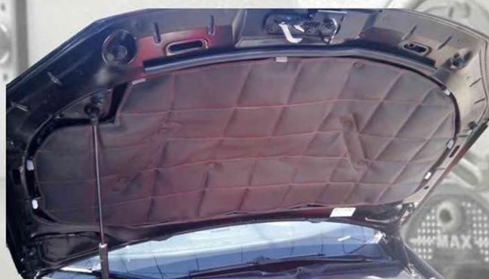
Тепло- шумоизоляция подкапотного пространства