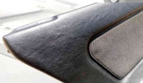
Перешив дверных карт