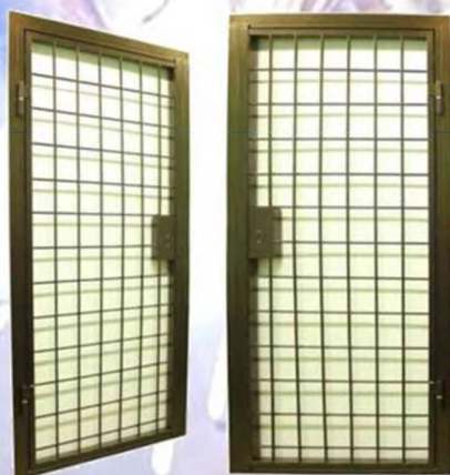
Двери металлические Различных конфигураций