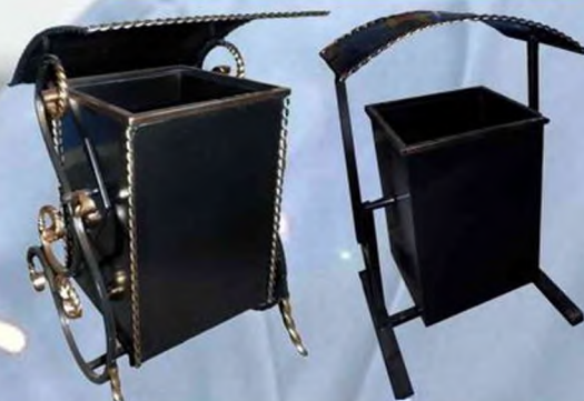
Урны металлические (также с элементами ковки или по вашим эскизам)