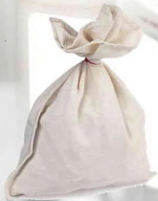
Мешки для геологических проб