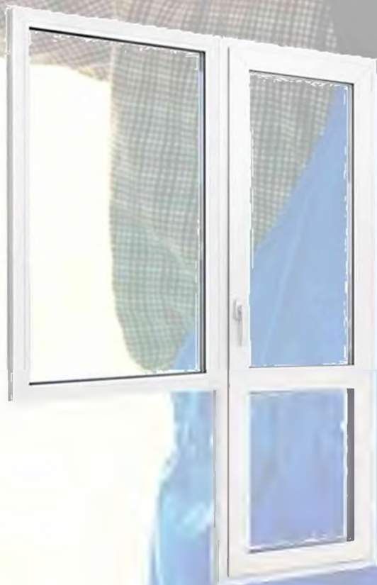
Балконные блоки ПВХ