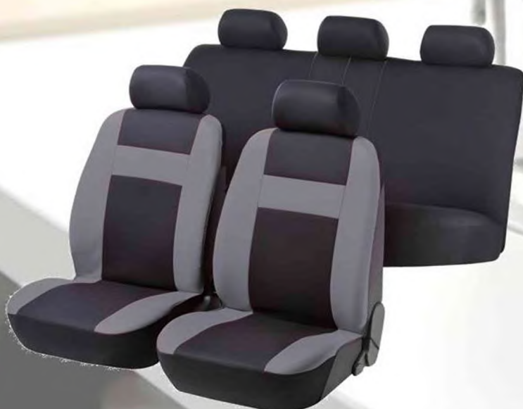
Чехлы автомобильных сидений