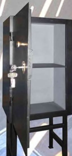
Сейфы (в том числе и оружейные)