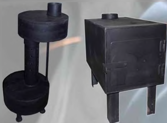
Печки (масляные, варочные, твердотопливные и .д.)